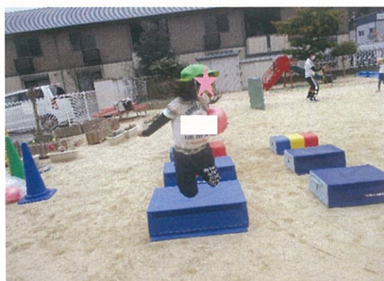
ボールを落とさないようにジャンプ！！