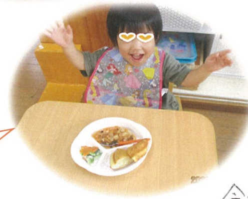
かえるの人参を 見つけて ぴょーんと大喜び♪