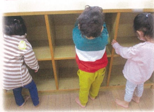
／ きれいになりました ✨ ＼