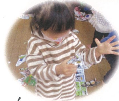
／ まるめてアイスクリームの で遊ぶの でさあわー！