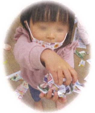
／ 広告をいっぱい あつめて...