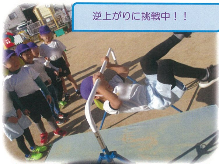
逆上がりに挑戦中！！

今日は運動の日！ 体操服を着て、戸外でしっかりと 身体を動かしました！鉄棒や跳び箱に 何度もチャレンジし、「もうちょっとで できそうだったのに！！」と悔しそうな 表情も見られました。 たくさん運動したので「全然寒くない よ！」と元気いっぱいの子も達でした！