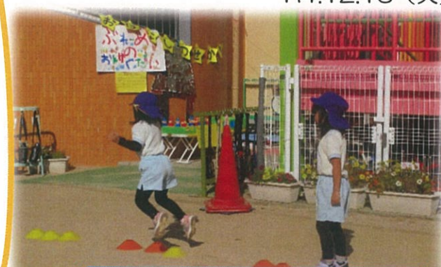
両足で思い切りジャンプ！！