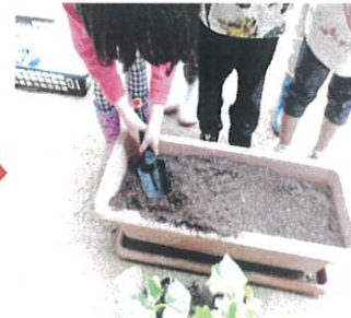
外に出てプランターの土に穴を掘って