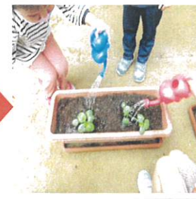
最後に水をあげました。