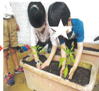
大切に苗を植えて