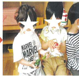
本物の野菜を触ってみて、チーム決めをしました。