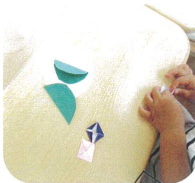
折り紙で花を折りました。