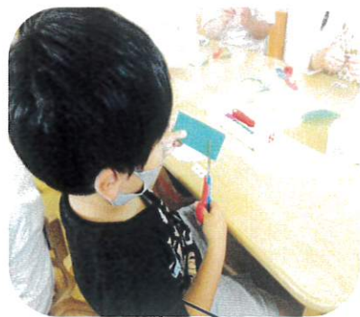
あじさいの葉っぱをハサミで切って