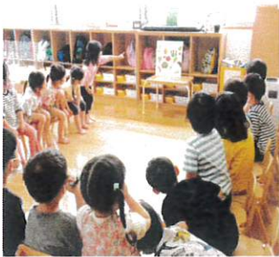
野菜の絵本を見て