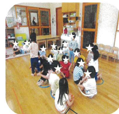
曲が止まると座ります。