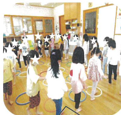
歩きながらフープをじっくり見て