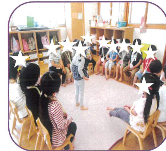
「りんご」「ぶどう」「みかん」の中から好きな果物を選び、クレヨンで画用紙に描きメダルにしました。ゲームが始まると、鬼役のお友だちが何の果物を言うが真剣に聞き、自分の果物が呼ばれると急いで席を移動していました。