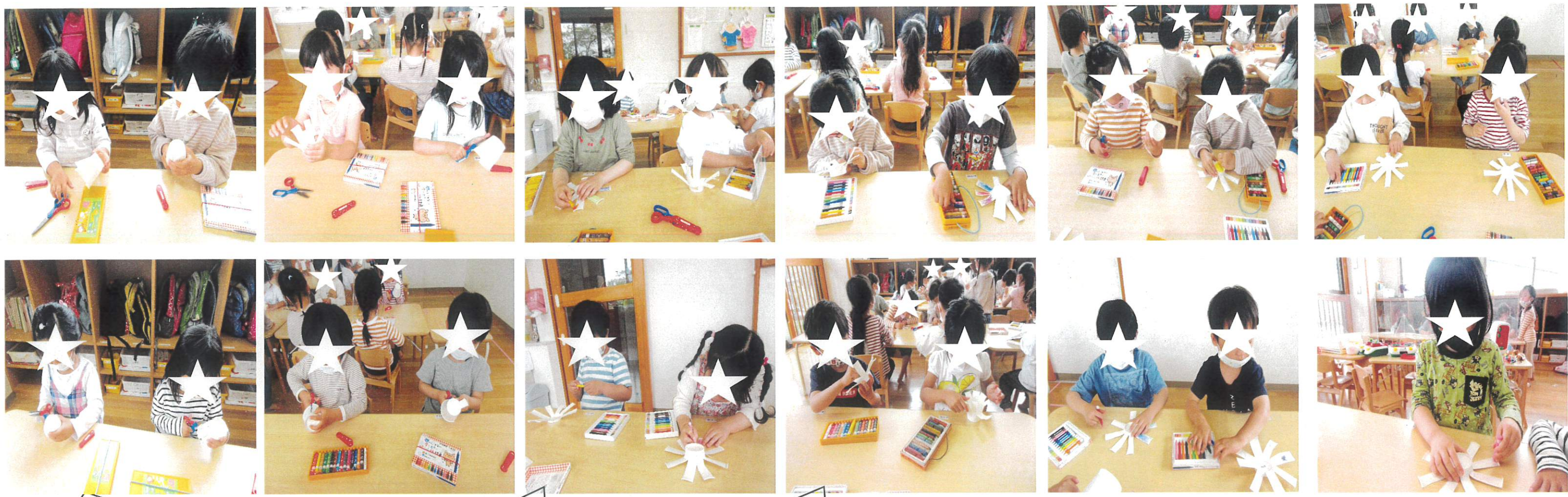
紙コップをハサミで切って羽を作って