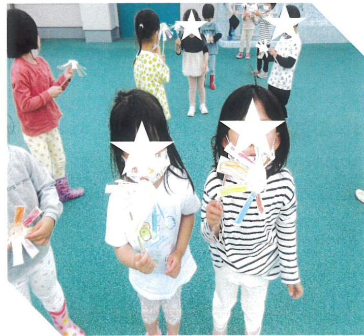
作った「風車」を持って行き、屋上に行って遊びました。風がふくとクルクルと羽が回り、とってもきれいでした。一人ひとり回った時の色の見え方が違うので、友だちと見せ合いっこをしたりして楽しく遊びました。