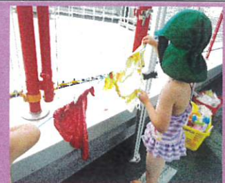
干していきました

「洗濯かあちゃん」のお話を読んだ後にみんなで洗濯ごっこをして遊びました。泡に洗濯物をいれてゴシゴシ洗いお水で流して干していきました。ごっこ遊びを友だちと一緒に楽しむことができました。