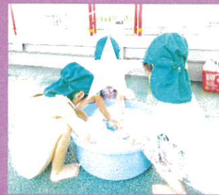
泡で洗濯物を洗い