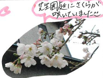
卒園児にさくらが咲いていました。