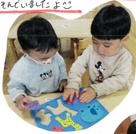
これはここにはめるわ!