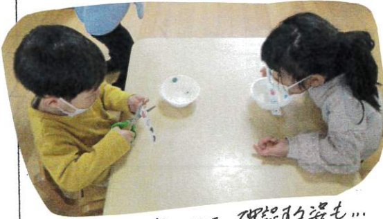
お友だちの姿を見て、確認の姿も...

◎以前は保育士といっしょにはさみを持っていた子達も自分で指を挿入、「グ、ハ、...」と口ずさみながら手に力を入れたり、離したり、をくり返していました