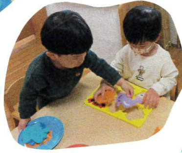
パズルあそびは、操作性や構成力、集中力が備わり、パズルに集中して取り組むことで、指先も器用に育ちます。