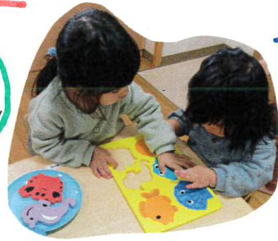
2人で仲良く考えながら、はめることを楽しんでいます。共感関係が育ちますね。