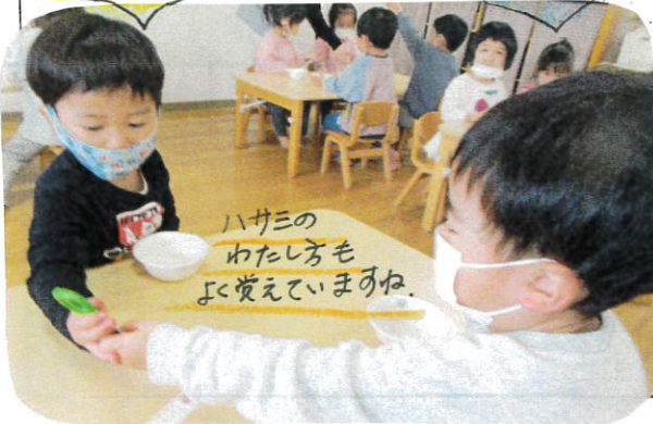
ハサミのわたし方もよく覚えていまるね。