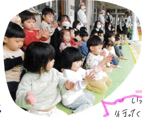
嬉しいやさしいさくらぐみのおいさん、おねえさんたちが、今日卒園おめでとう。ちやーりっふぐみも、お見送りに参加しましたよ。