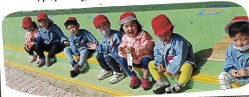
休んでいる時の応接お手をすね。

ルール(玉はゆかぬ・おなかの中は投げ箱の合図で終わるなど)いろは21ルールを理解、みんなであそぶ楽しさを味わいました。