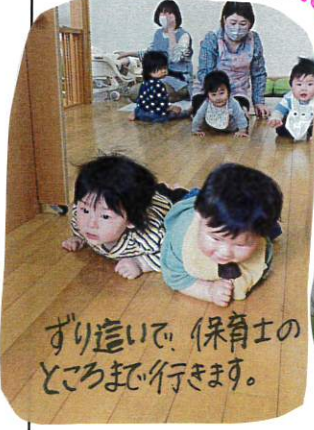
ずり這いで、保育士のところまで行きます。

「おいでー..」保育士が「おそとでるよーおいで、と口ずかけると、ハイハイやずり這いで自分でテラスまで行くことができます。少しずつ保育士との信頼関係ができていますね。