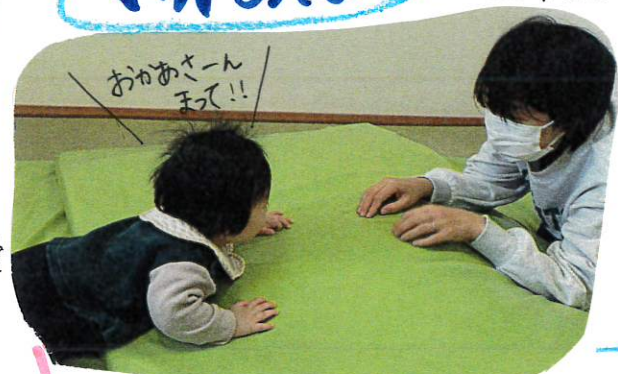
お母さんの「おいで」の声で、マット山を一生懸命のぼっているくん。しっかり足に力を入れて、マットをけって上手にのぼり、お母さんの所にたどり着きました。