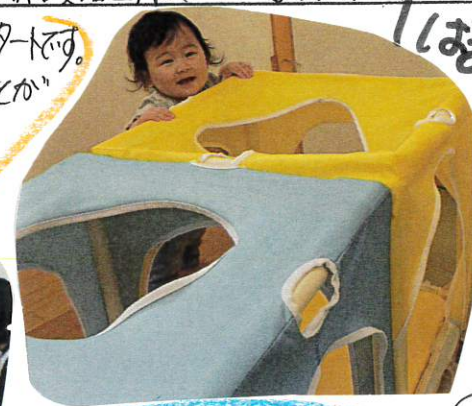
トネルから突っ込んでばあ!!と音を出し、お母さんを見つけて大よろこびです。