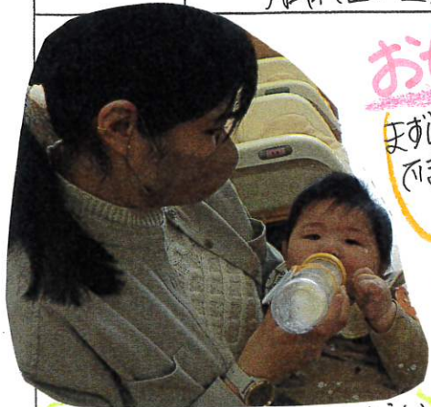
お母さんにミルクを飲ませてもらう安心した様子ですね。

まずは、お母さんやお父さんと一緒に慣らし保育をして、子どもたちが安心して過ごすことができています。お母さんたちに見守られる中、好きな玩具を見つけて探索活動を楽しんでいます。