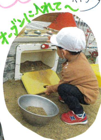
おまじないにのせて〜