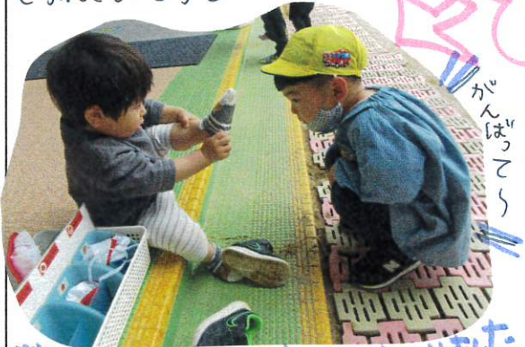
お兄ちゃんがずと見守ってくれていました