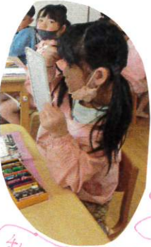
私の目描って どんな目？!