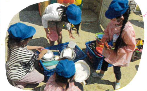
これはこちらのワゴンに入れるよ!