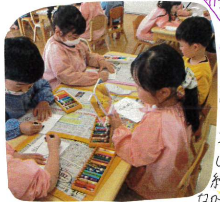
口はどんな 开きかな？

今日は「自分の顔」をワゴンで描きました。まずは一人ひとりの鏡を見て、目、鼻、口等、自分の顔のパーツを確認します。実際に触ってみて確かめる子の姿も見られました。