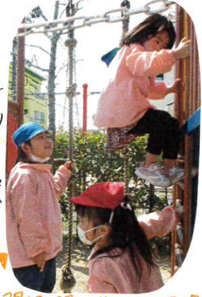
間隔開けて並んでます!