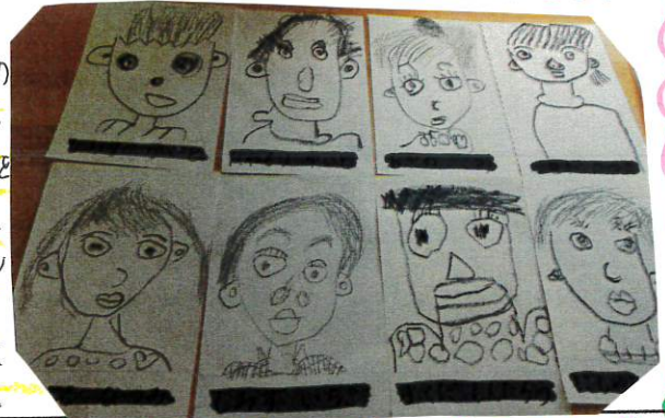
個性豊かな素敵な顔が描けました。