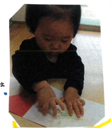
ミールを見占ってその上から手押さえる Mちゃん。くっつくのが面白いようでした。

丸ミールを台紙からはがすのが難しい子には少し折って耳をやすくすることで耳をはがすことが出来ました!!