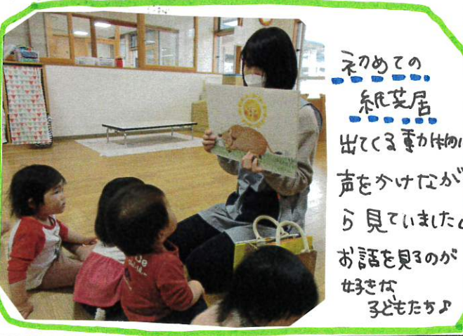
初めての紙芝居 出てくるキャラクターの声をかけながら見ていました。お話を見るのが好きな子どもたち。