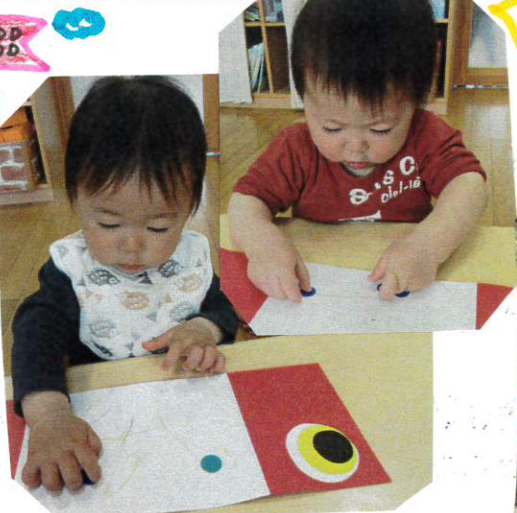
初めてのミール貝占り ミールに興味津々でした

昨日、なぐりま描きをした画用紙に大きな丸ミール、中くらいの丸ミール、半分に切ったミールを貝占り、こいのぼりが出来上がりました。