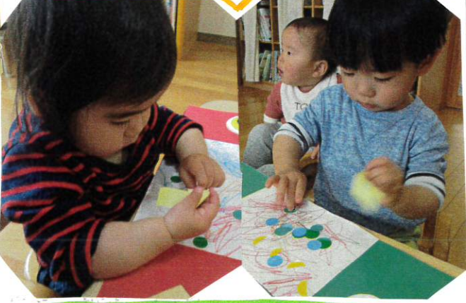
小指をた手つきでへたへたに見占るくくと Mちゃん。ミールのミールも上手に見占っていました!!