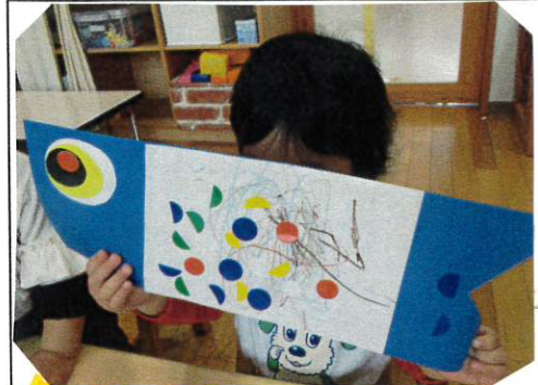
完成!! と嬉しそうに見せてくれた Mちゃん