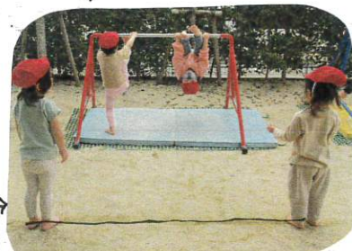
体操教室で習った金矢棒がゲームで

自分の体の重さや向きを考えて楽しむと、待ち時間も自分で10まで数えて交代です。両足ジャンプ? しゃがんで足腰を