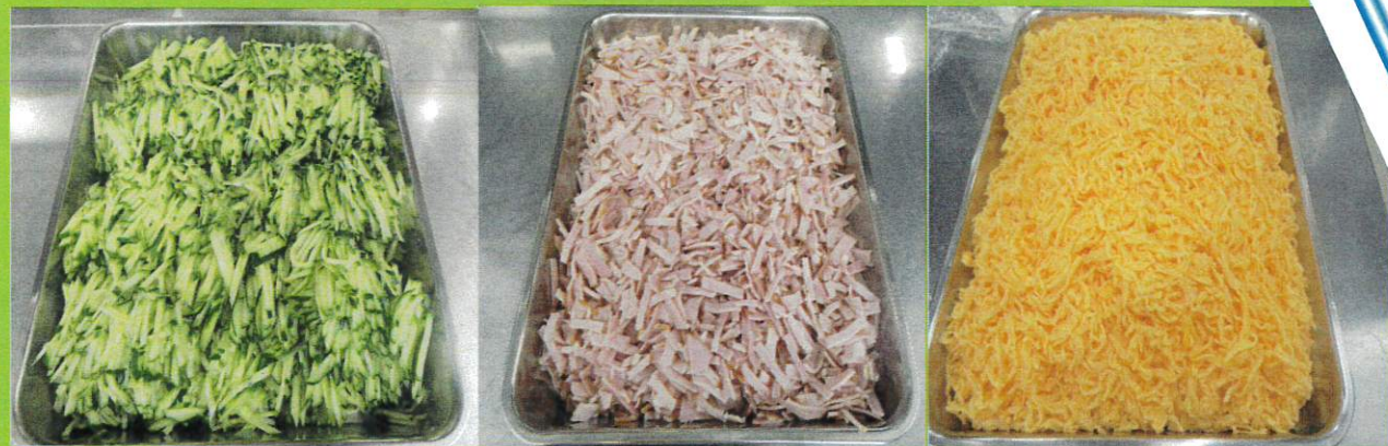
胡瓜 ・ ハム ・ 錦糸卵