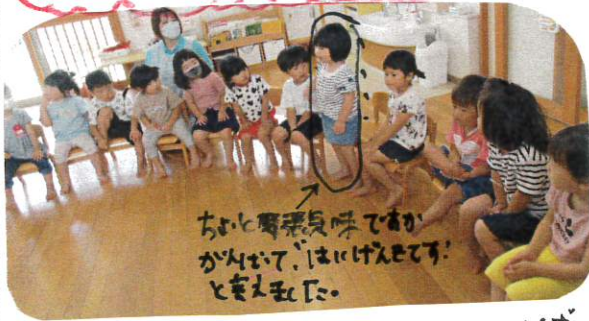
ちかちか身振りで歌がわがわがははははと歌をうたっていました。

2回目のゆり組とばら組の交流会がありました。 幼児クラスの朝の会を体験したり、ゲームやる機会、あそびをほめました。