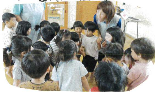
みんな小さくあつまれ～!

♪大きなたいこあでは全員が手をついで大きな輪がくまをたたく... 一体感や達成感を味わいました。