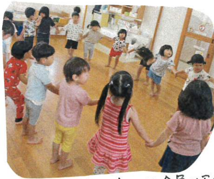
お手拍子おとモだち♪

朝の会では、お当番さんのセリヒヤ、みんなお名前を呼んで、退席します。ゆり組さんのお手本となりよう、カワイイ声かけが見られました。