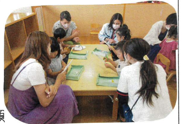
はさみにてレコシ