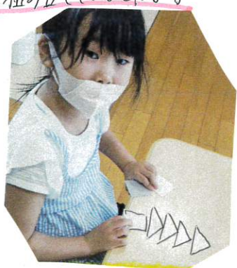
クリスマスツリー