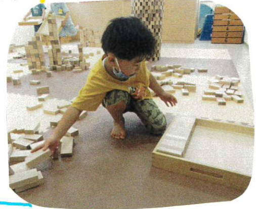
集中して、真剣な表情に...

部屋に戻ってから、けん玉の練習は続きます。だれが1番に入るかな?と子どもたち同士で競争する姿なんかも見られます!!