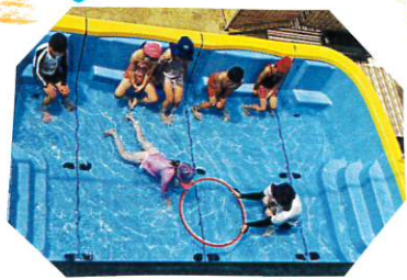
もぐって7-70を くぐらした...

今日は、朝から土曜日に行き、 『夏まつり』の話で持ちまりの 子と友達。「一緒にかき氷食べたいね!」 「おまきや元気にしてるよ〜!」等と、 友達との話に花を咲かせていました。 活動前にも、どんな思い出があるか たずねると、皆、嬉しそうに発表 してくれました。♡