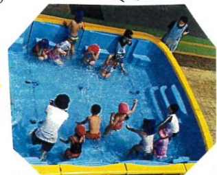
水のかけ合いこと ほした!!