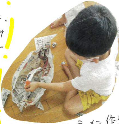
細く切って、ラーメン作り。