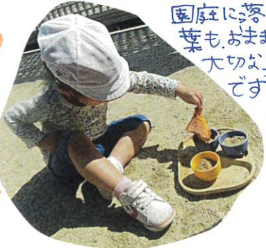
園庭に落ちている葉も、おままごとの大切な具です!!

お友達との関わり の中で上手に 気持ちをセリ がえている姿が たくさんみられます