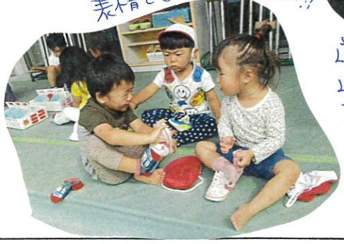
表情で喜ばせてくれるとCwモ!!

お友達との関わり の中で上手に 気持ちをセリ がえている姿が たくさんみられます