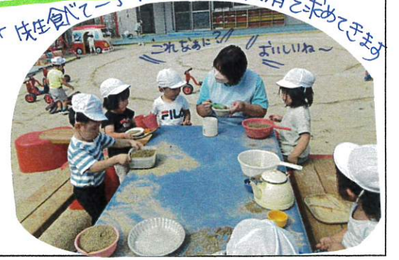
「先生見てー」これなに? おいいね~

自由に遊ぶ中に、一人一人の思いが出てくる戸外あそび。お友達とのやりとりもとても上手になってきました。その中でお友達の問題を夏も解決してあげようとする姿もたくさん見られるようになってきました。カブクで取り合っていたのが、言葉で伝え合う姿も多くなってきています。それでもトラブルになる事もまだあります。仲立ちしながら言葉で伝え合う事も学んでいきます。たくさんの子が共有を求めてきます