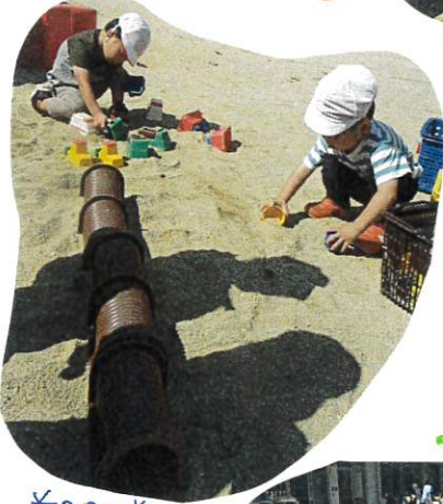
道路の道を進んだ後車庫に戻すCw!! 決まっていたら守ります