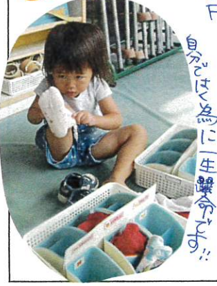
自分らしく自由に生活できるように!!