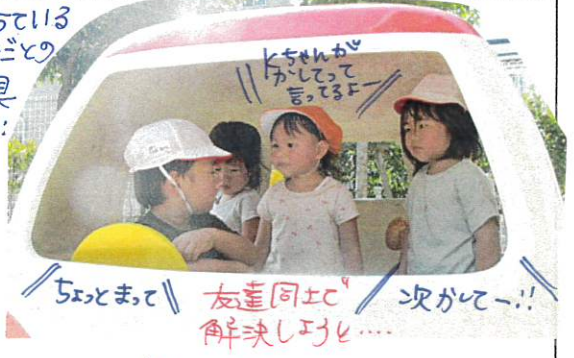
「ちよとまと」友達同士の「次がてー!!」解決しよう!!