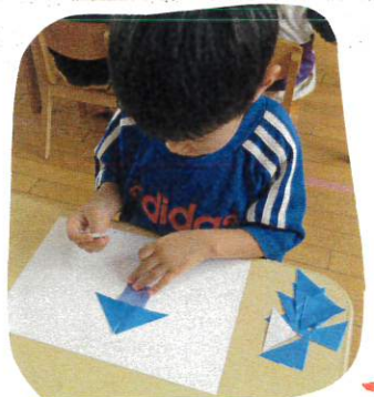
(はじめは自分の切った 三角にだけ使ってあそんで いきなりが...)