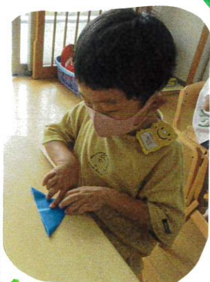
きれいに合わせて...