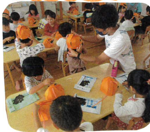
お父さんと一緒にゲームを楽しみました。