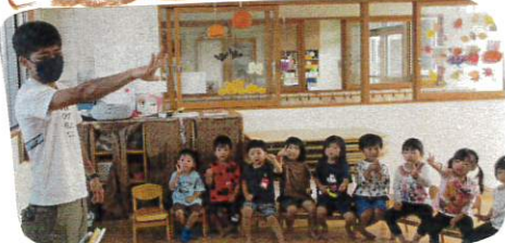
しせんけんゲーム