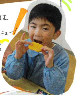
今日の給食はハロウィンメニュー

お菓子は、保育園の近所や調理室など、写真を見ながら探りに行きます。自分たちで考え