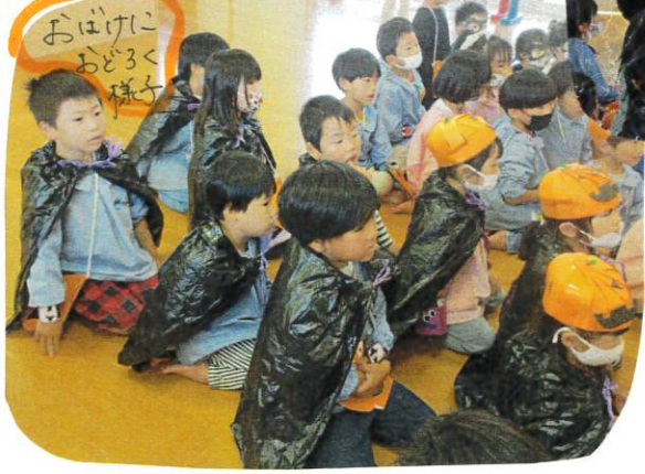
おばけにおどろく様式