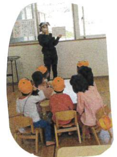
ハロウイン クイズ