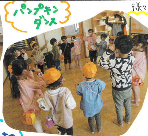
パンプキンダンス