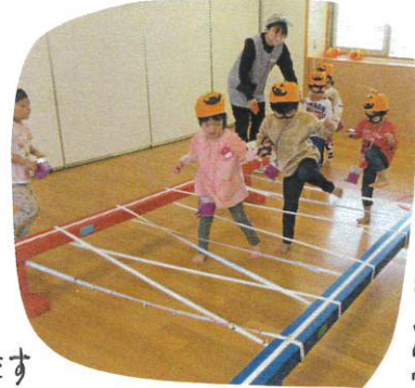
ワモの巣レース パーティー