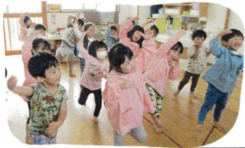
フービートのおそ松ダンスどろもかゆいでおわ