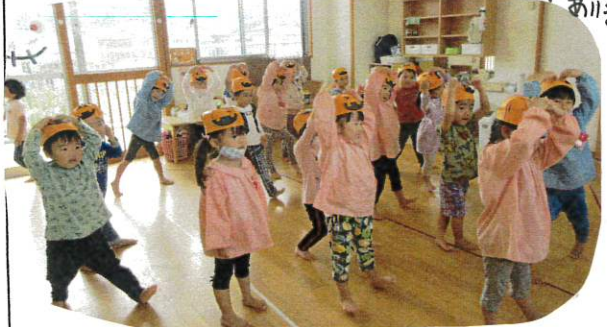
ハロウィンの踊り。最後のかぼちゃのダンス

こんなにかわいいどんぐりが出来たよ。くり返し何回も折るうちに、一人で何個も作れるようになったよ