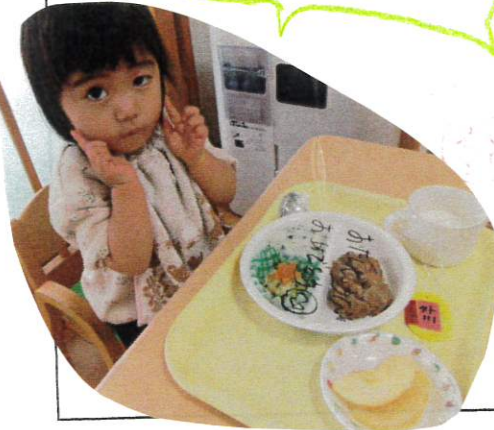
言周理の先生からメッセージ付きの 給食に大喜びでした♡

少しづつ衣装を着たり、小道具を持ったり しながら、発表会に向けて、劇あそびを 楽しんでいますよ👏