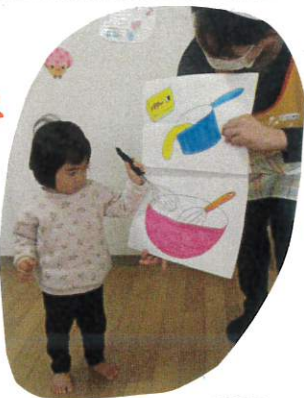
まーせませ おいしくあれ♪

♪ たんたんたんたんたんじょうび♪ みんなにお祝いされて、とても嬉しそう な表情を見せてくれたTちゃん、Hちゃん。 2さいのお誕生日、おめでとう!! パネルシアターを使って、一緒にケーキを 作りましたよ🍰