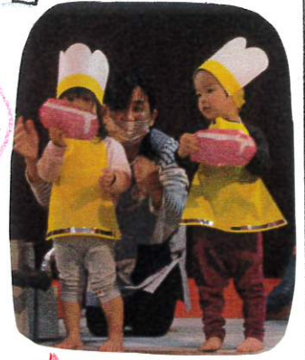
前に出てセリフも 言っていますよ♡