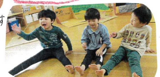
表情も豊かに友だちとテンポを合わせて行いました