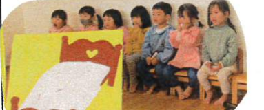
出番を待つ人も、しっかり物語に入りこみます