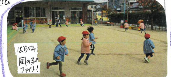
最後は体力UP寒さに負けぬよう10周走りまわ

フープじゃんけん 見お見おでかいて、いっのこにいっのこを順番していきます 年止りに挑戦しています