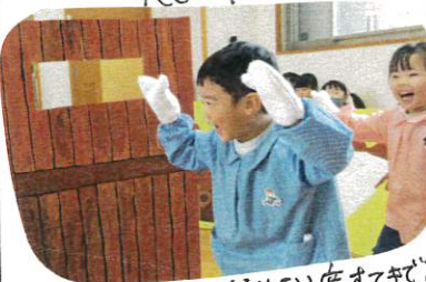
自信をもって大きな声で

自分のセリフも覚えてきて、日に日に自信をもて取り組んでいます。セリフを思いきめて大きな声で言うことがかんばりました。