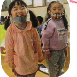
見られる事を意識して物語の登場物になりきろう