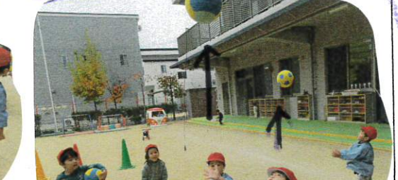
またまた友達が集まって「いせーのーで」の上に投げたり