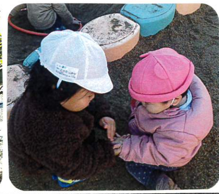
近くで遊んでいた ゆり組(2歳児クラス) のお姉ちゃんが手についた砂をほらいに 来てくれました。 「だいじょうぶ？」と優しく してもらって嬉しかったです。