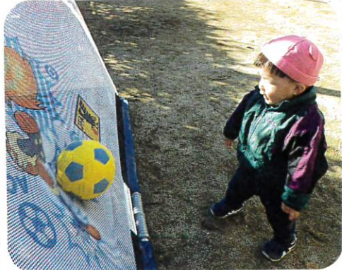
今日も戸外でしっかり身体を動かして遊 びました。シャボン玉に角触れたり、 ボール遊びをしたりして楽しみました。