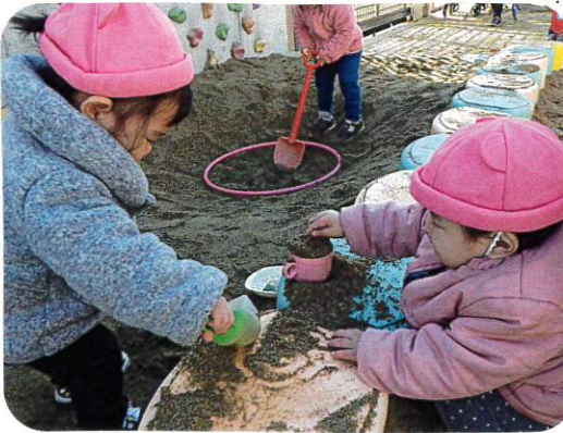
お砂場ではカップで型を取ったり、崩したり、 砂の形がかわる不思議さを感じました。2人で カップに砂を入れて遊ぶ姿も見られました。