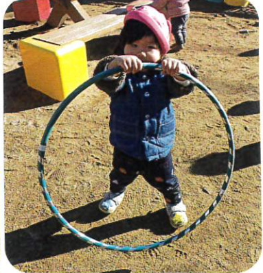
フラフープではバウンドさせて 遊んだり電車に見立てて遊び ました。「しゃしゃ」と言いながら 歩いて楽しんでいました。