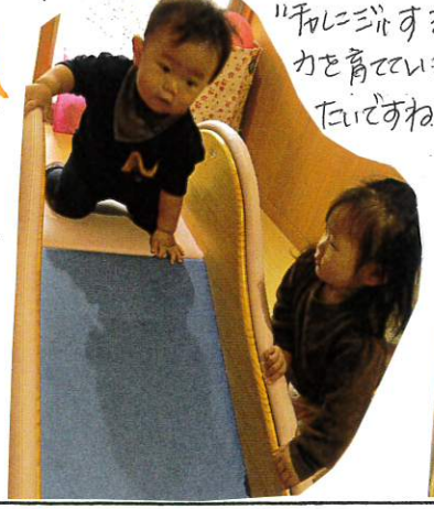
"おにぎり かきあげ たいだね"