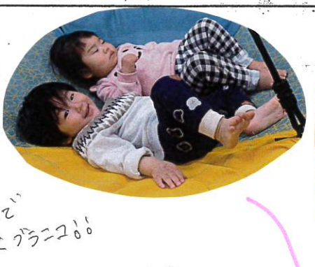
2人で仲良くグラニコ!!