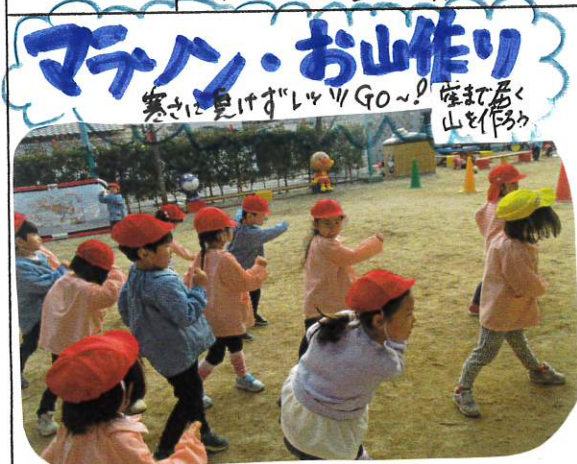
寒さに負けず「レジャーGO〜!」を打って山を作ろう