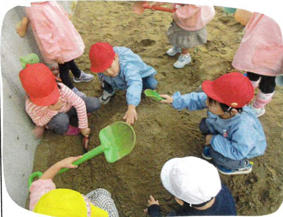
役割を決めて1つの事に友だちと夢中になって取り組む姿もみられるおいてきよ