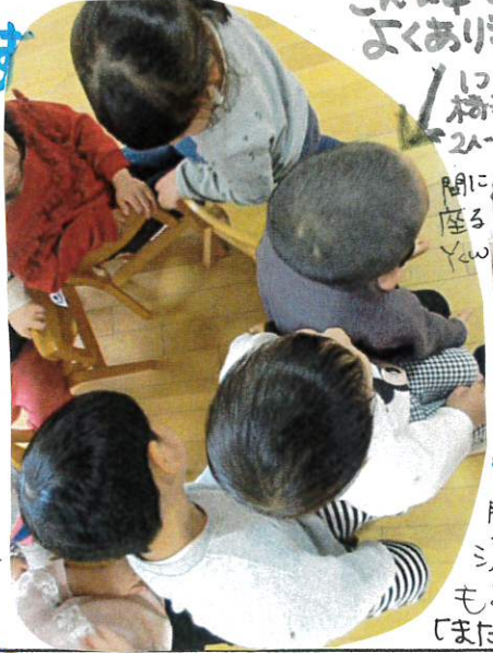
1つの椅子に2人間に座るYew