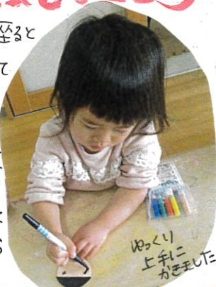
ゆくり上手にかきました!!

おひな様の前に座ると自然と無口になってじーっと見つめる子ども達。きれいな中物。素晴らしい中物をよくわかっています。大切に扱う事も矢口させています。