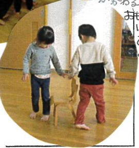
毎回升のかわるからおもしろいゲームだね!!

月替りするゲーム。負けてくたくたくしてシヤする子は、いけませんでした。お券員もよくわかるようになってきました。またやるからね、くちゃん、次回も楽しみにできるようにしました!!