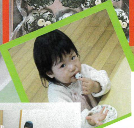
みんなに人気の くるすけおむすび!! アレルギー用には 豆乳のチーズ使用🍞