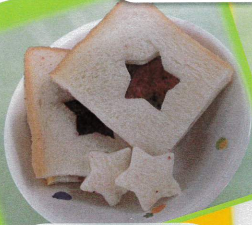
さくら組は バイキングスタイル