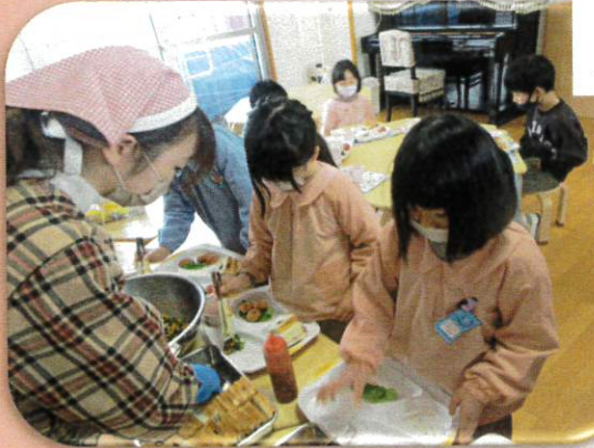
毎日のおやつでトングの練習中 上手につかめるようになってきました。