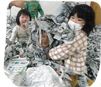
負けてRくんがうらやま していと。RちゃんとSくん がだまかしてだまかしてま した。お友達の気持ちに ふりかえり行動しています。