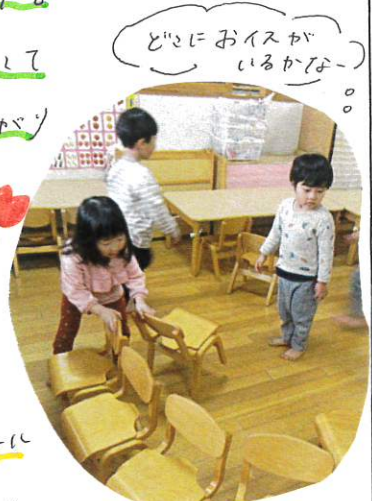
どのおアイスか いるかなー

先生おた! みつけた! とおもい、い 新聞をかきました。 先生お、かけまわして 鬼ごっこも盛り上げ ました。 アイスとり ゲーム