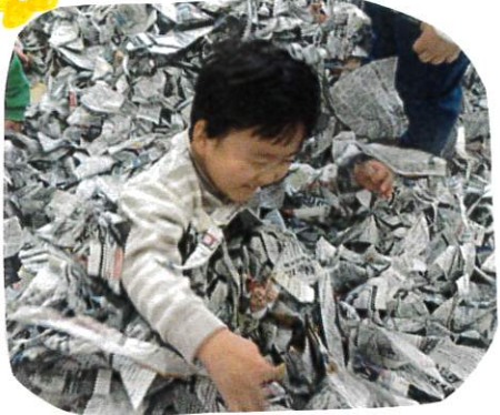
トランスにクレーンで津山かけるゾー。 とRくん。俊にゆくり新聞。

今日はあそびパーフ2日目。 おもい、い新聞でいあそび ました。ねこがたり、走たり 津山はせました。