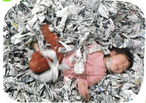
Rくんおうちな、たネー。 かすぞかかすぞ! と Yちゃん

今日はあそびパーフ2日目。 おもい、い新聞でいあそび ました。ねこがたり、走たり 津山はせました。