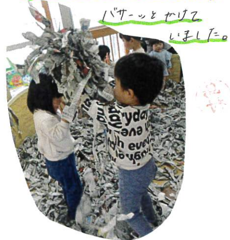
バサッとやって いました。