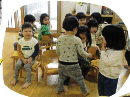
自分でさぞいそ用意 するところからスタート。ルール がよくなるまでからこえ。 負けた時の悔しがすこ おきます。