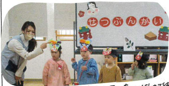
自分たちで作ったお面を素直に所を褒められた