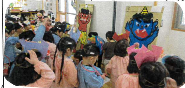
悪い事をもっているおにを追い払っている