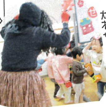
大きなおにがやってきて、ビビッの子たち