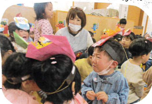
小さい時から「おにー外」とおにを追い出すのが大好きになりました。最後は、福の神が来てくれて、みんなでおにのパンツを踊りました。