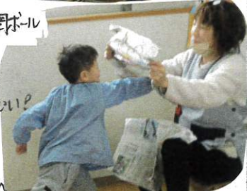
③新聞の2手で力強く!