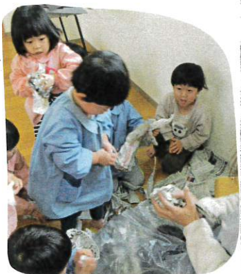
④最後は柱とにぎってボールを作りました