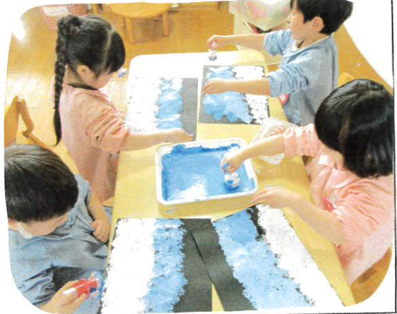
↑キレイな青と 背景色が出来たよ

② 次に青を入れて、空を描きました。 白に青を入れると「あ、キキ!!」外色に なりました!! など、色んな気づきがあ りました