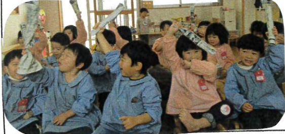
♪みんなではらうおニの10ツ!! イェ!! のポーズ!!