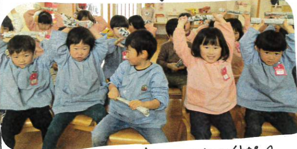
②おニの10ツの曲に合わせて全員に体操!