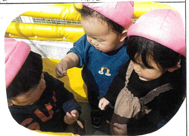
散歩の途中に"つし"をあげました。つしをもってみんながいます。興味津々です。