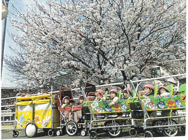
天気も良く桜も満開でとてもきれいです! たんぽぽ組さんごの散歩ができました。