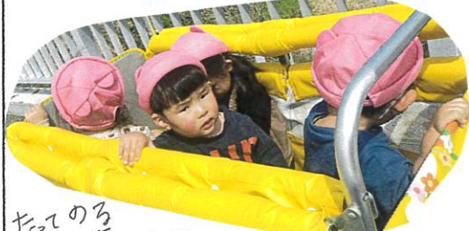
たってのる散歩車=上舟ののってます!