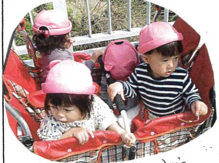
手わいの景色をみながら散歩をたのしみます。