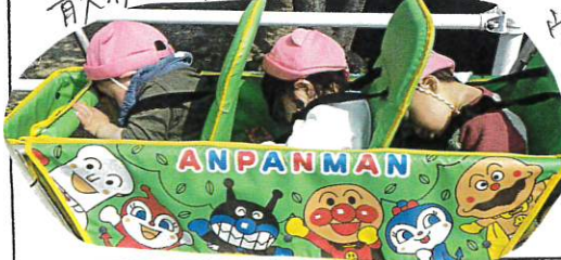
たんぽぽ組はきもちよくたのしく散歩ができました! わあ! わあ! じゃあね