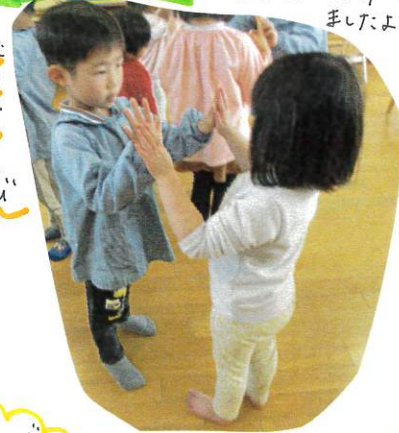
あたま・かた 手は〜まっぺん!! 歌に乗せて ふれあいを 楽しみ ましたよ!!