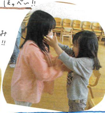
手は〜耳!! 優しく思いやり をもってリトしたり、 お兄さん・お姉さん の一面が見られ ました!! ゆりぐみさんと、嬉し うに手をたいて 楽しんでいましたよ!!