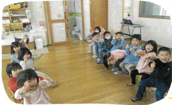
あたま・かた ひざ・ポンの 替え歌で ふれあい あそび