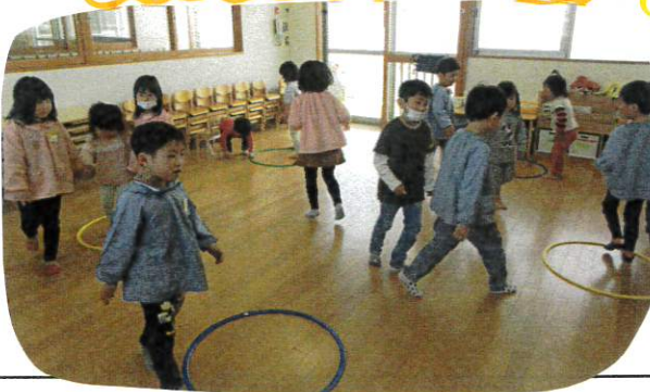
フライングの数が 徐々に 少なくな...