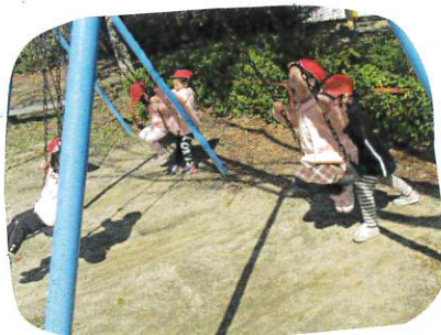
↑ブランコも順番を守り、仲良くあそびました。