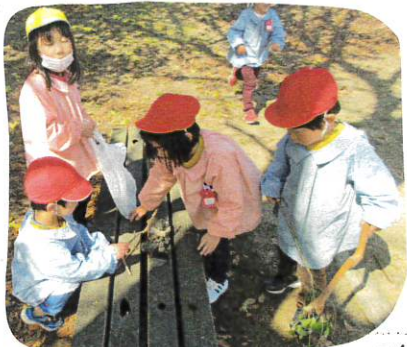
↑公園では、子どもたちがいるとお宝を探し、集めてあげました。