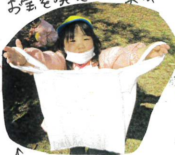
↑これにたくさん集めて

ひまわり組さんが、道のはいこを歩くお声をかけてくれたり、前からはみられないように、おんぶのりついでにリードしてあげました。