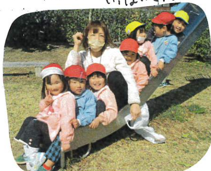
↑みんなであそびたい、気持ちいいな!