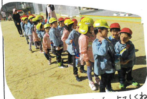
↑あそびたい、あそびたい... よろしくね?