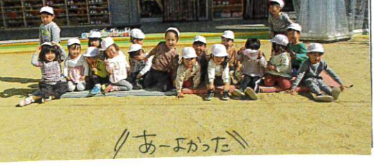
★ おうの中には入れないよ