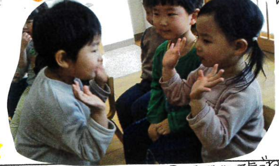
★ 目を合わせて マチ マチ 元気な声が響いて

絵本「おおかみせん いまなんじ?」が大女子です! おおかみのやりとりが大好きになりました。たまたま近づいて緊張感も高まっています