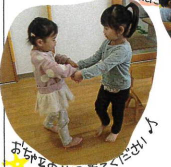
★ おおかみのみまきでください