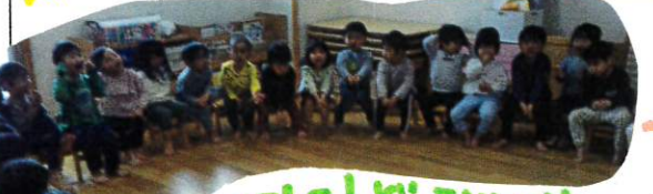
★ うさぎとよ! どちらに!!

うさぎとかめ 保育士による出し物、静かにお話の中、言葉を聞きながら一発者にお話の世界へ入りこんで聞けていました