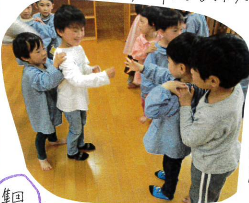
チーム対抗 ボール送りゲーム