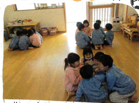
サッカー参観のチーム名をグループごとに木目言堂して決めました。みんな考案。話し合い真剣に意見を出していました。