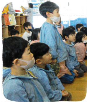
しっかりお話を聞いたAくん。理解した事をみんなの前で発表しました。