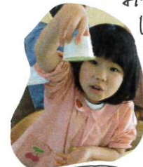
あね不思議でいいよ