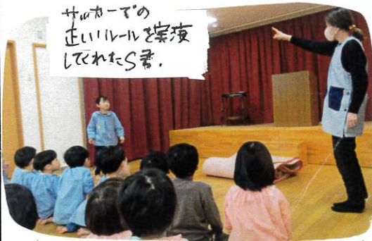
サッカーでの正しいルールを解説してくれたS君。

今日はいつも使っている園庭でサッカー遊びでのルール、かばんの入れ方など、や話を聞く大切さについて、聞きましょ。