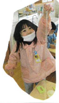
みて! ままのまの伸ぶよ