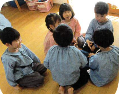
その内、子どもたち同士で、(みんなの力を合わせ)、グループ名を決めていましたよ。