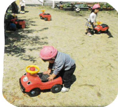
↑ コンビカーを押したり 乗ったり、重さを楽しんでいます