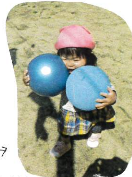
↑ 大きなボールを2つもちょう外そうなけちせん