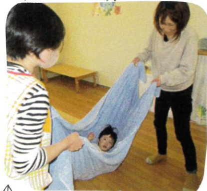
↑ ハンモックに寝ころんで、左右にゆらゆら〜と歌に合わせて揺らすと、ちよと緊張がみだいたけど、心地よい揺れを楽しんでいますよ