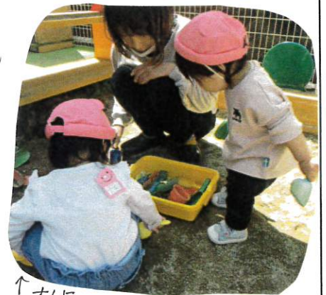
↑ 大気の石少場あそび スコップやカゴを使って おままごと 熱中してあそんでいます