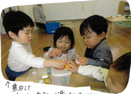
↑ 集中して 布あそびを楽しんでいる子どもたち