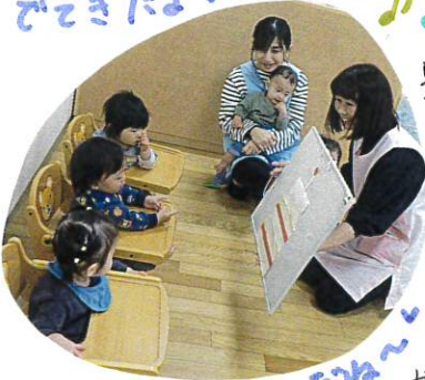
おもちゃのチャチャ