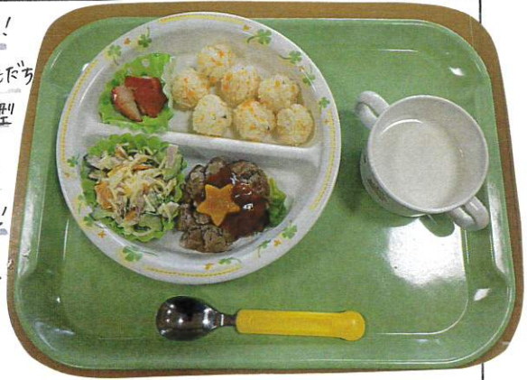
今日の給食!! 誕生日見のおともだちの給食には星型のにんじんが入っています!! うれいね