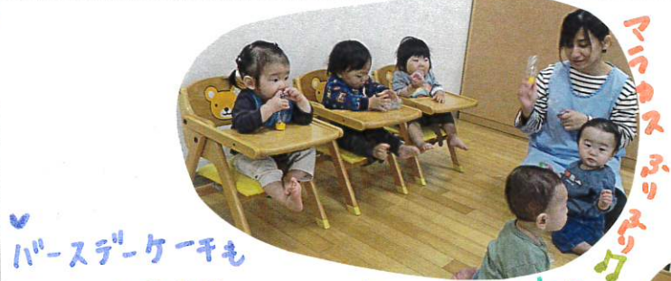
バースデーケーキもでてきたよ

今日は、4月うさぎのおともだちの誕生日会がありました!! 3人のおともだちが1歳になりましたよ!! バースデーカードを見せると、興味津々のかわいい写真も貼ってあります!! みんなに誕生日のうたをうたってもらい、拍手をもらってうれしそうでした!!