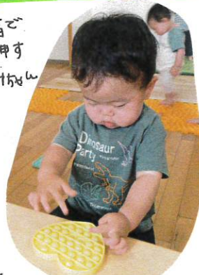
Aさし指で押す Aちゃん