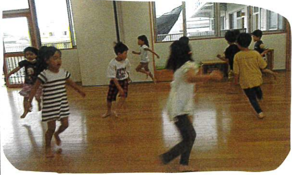
友だちとぶつからないように、スキップ