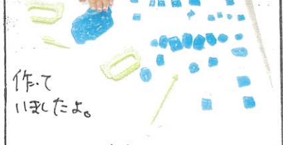
作って、いきましたよ。