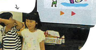
↓ 魚の色と2人で話し合い、決めたお魚とスタート