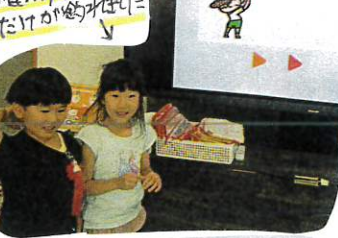
色んなお魚のたくさんのお絵描き、魚を描きました。