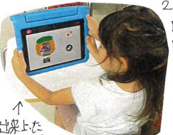
↑ 出来上がった作品に自分の写真をIPadでとして保存します

今日は、4歳児のひまわり組のみんなと一緒に、IPadを使って、お絵描きを楽しまました。