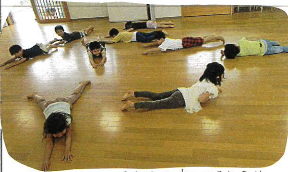
曲が止まると、STOPやポーズをとり、うぶでいる、リリ... 様々なお絵描きをしてみました。