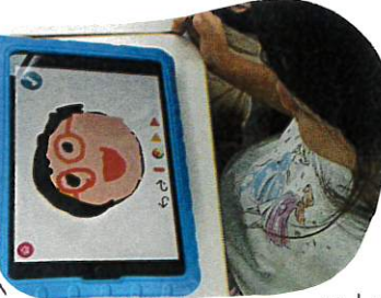
↑ ○に何をかき描いてみたり、お絵描きをするときに、先生の顔を描いてくれた子がたくさんいました。