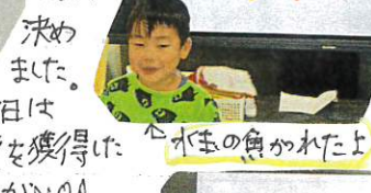
今日は、7票を獲得し、この3人がNO.1になりました。

では、2人1組になって話し合い、描いて見ました。描いた作品をみんなで見比べて、投票してNo.1を決めました。