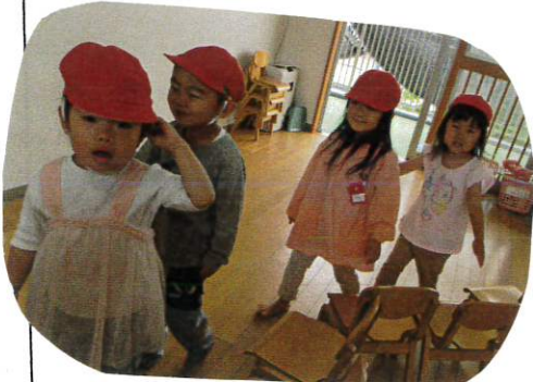
今までは座れなから 振って応援するという ルールでしたが、今日は 座れなから、赤、帽子の 色を変えて、繰り返し参 加しました!!