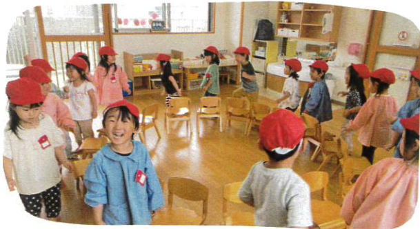
はじめは全員、赤帽子でスタートです!!