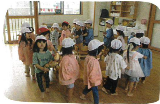
たとえ座れなくても、次がんばるぞ!!と 気持ちを切り替えられています。