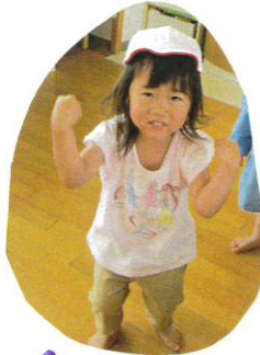
ごも次は 元気が張るぞ!!!