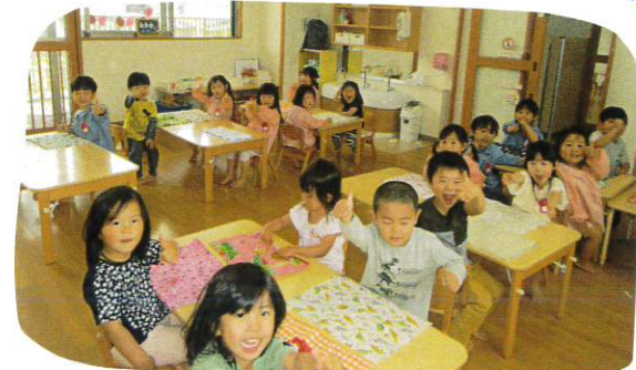
さすがが ばら組さん