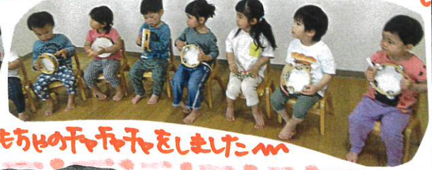
おもしろいあそびをしました〜

ひさびさにタンバリンとすすで合奏をしました!!「タンバリンとすす、どっちがやりたい〜?」と聞かれると「タンバリン!!」と答える子、お友だちを見ながら手をあげる子、様々です。楽器をもらうと嬉しくて、すぐに音を出しちやいます。しかし、そこはぐーっとがまんをしてお胸にセーブとある音が聞こえませぬ。そんな今一番がんばってやりました!!