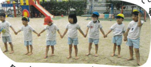
↑2組さんは今日は反撃できたか? チームワークはばっちり。