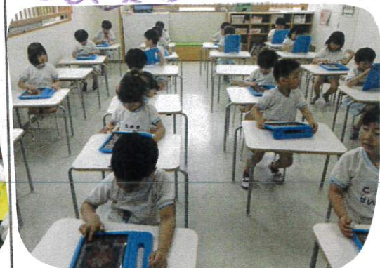
↑集中して取り組んでいます