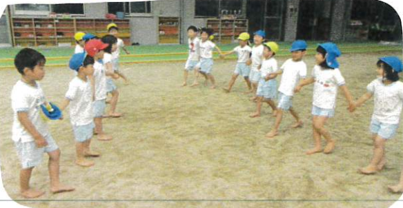
↑最初は11名からスタート!