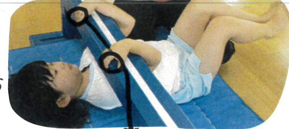
これは、傾斜車の基礎腕の力をつけます