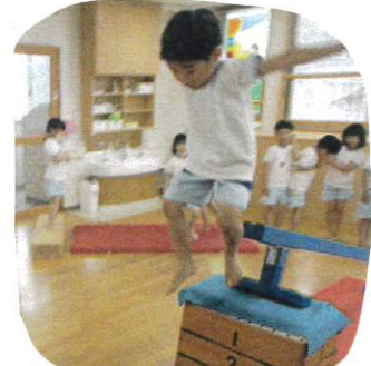
今日は、指先や足先の力を意識させた運動あそびを行いました。