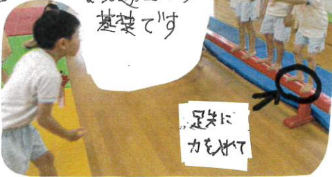
足先に力をつけて