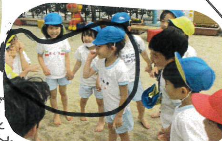
↑ドンドンしなからジャンプ? 月着たチームからは大歓声が出ていましたよ