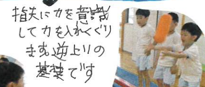
指先に力を意識して力を入れてくりまわす遊上の基礎です