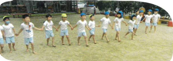
今日は1組さんが大勝? なんで1回しか負けませんでした。