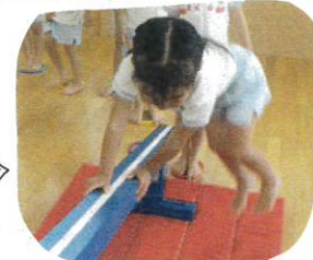
平均台をまたいで左右にジャンプ!