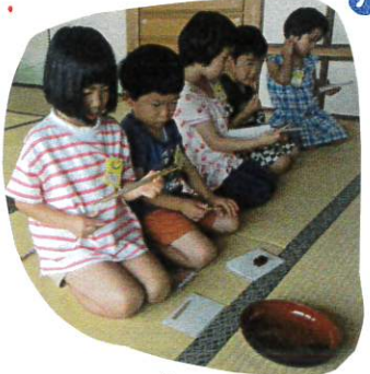
箸を持つ手順も. 考えながら取り組める よくなりました!!

今日は. 2グループのお茶の会に行ってきました. 少しずつお茶室の環境にも慣れ. 程良い緊張感の中で. 1つ1つの動作を. 丁寧に身に付けていきます.