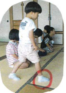
畳の縁は踏まずに. 右足から. 畳の角を通ります.