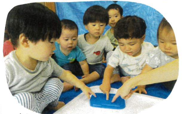
これは何かな? 指先でちゅん!! つめたいよおき