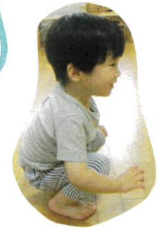
よちよち ♪ アヒルさん〜