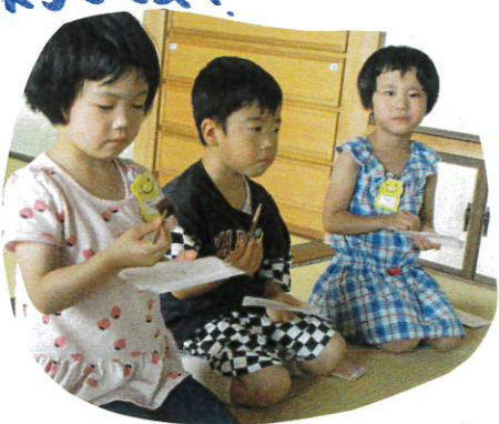
黒文字を使って2等分にして食べるのも. 上達してきましたよ。