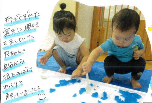
形がとびだした 寒天に興味 を示していた Rちゃん。 自分から 指の先で ゆいゆい 触っていました♡