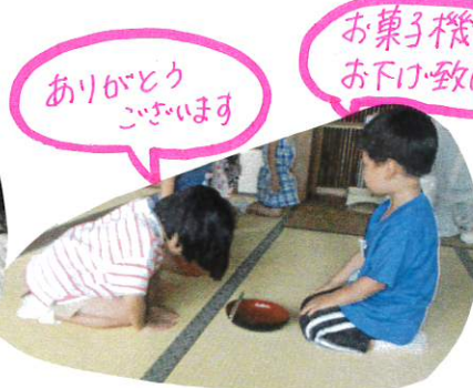
状況に応じた言葉も考えながら 取り組んでいます。