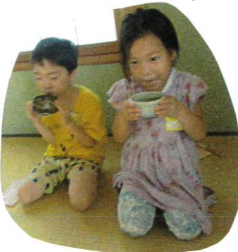
入れたてのみ茶を頂きました. 普段. あまり味や香りのない. 苦味と 体験する事も. 良い経験ですね。