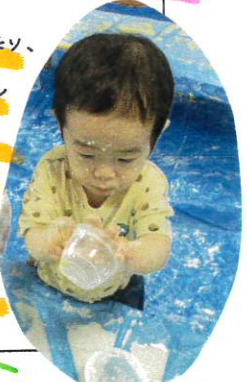
最後まで感触に 夢中でした!!

スプーンでカップに入れたり、 カップからカップに茶多し 替えたり、両手でダイナ ミックに角切したりして 片栗粉の感触も自分 に楽しんでました。他に色 々な感触あそびを準備さ していきたいと思ひます♡