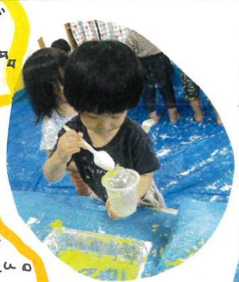
3点持ちで スプーンが 持ていけず

昨日は11つと違う部屋に戸惑っていた 子も少しずつ慣れ、机についている固まった 片栗粉スライムを角切したり、指でこねている 姿も見られました!! 11つと違う部屋も もてたので良かったです!