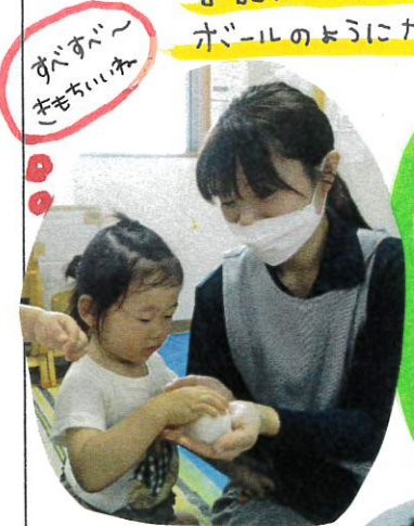
あそびが～ きもちいいな

昨日に引き続き、片栗粉スライムで「感触あそび」をしました♡ 容器に入れたままのスライムが「固まっていたので、それを丸めるとボールのようになりました!!